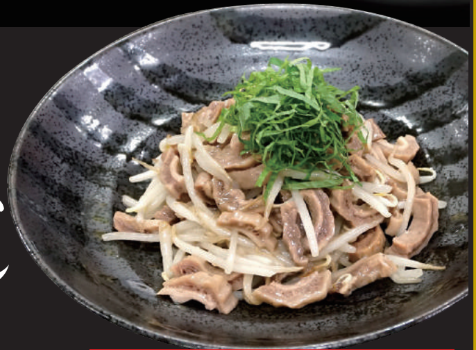
スタミナ源たれ味